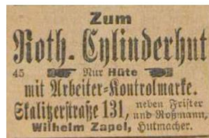
04. Januar 1891, S. 10