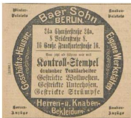
Abbildung: Auswahl von Inseraten mit Bezug aus Kontrollmarken ( Vorwärts )

Die Kontrollkommission der deutschen Textilarbeiter in Chemnitz bezifferte wenige Monate nach Einführung eines Labelsystems ihre Einnahmen auf 470 Mark. Legt man die übliche Gebühr von einem Pfennig pro Marke zu Grunde, welche Unternehmen zu zahlen hatten, um die Zertifizierung zu erhalten, wurden maximal 47.000 Marken verkauft. 611 Von den 400.000 für die Arbeiterkontrollkommission der Hutmacher hergestellten Marken gelangten innerhalb der ersten Wochen nach Einführung des Modells 60.000 in den Verkauf. 612